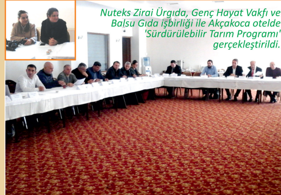
Nuteks Zirai Ürgüda, Genç Hayat Vakfı ve Balsu Gıda işbirliği ile Akçakoca otelde 'Sürdürülebilir Tarım Programı' gerçekleştirildi.